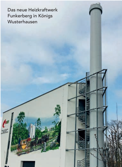
Das neue Heizkraftwerk Funkerberg in Königs Wusterhausen