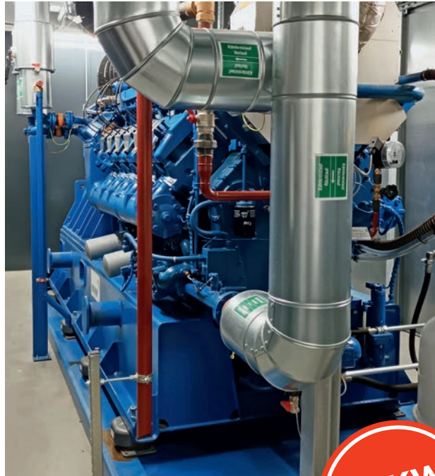
Eines der neuen hocheffizienten BHKW am Funkerberg