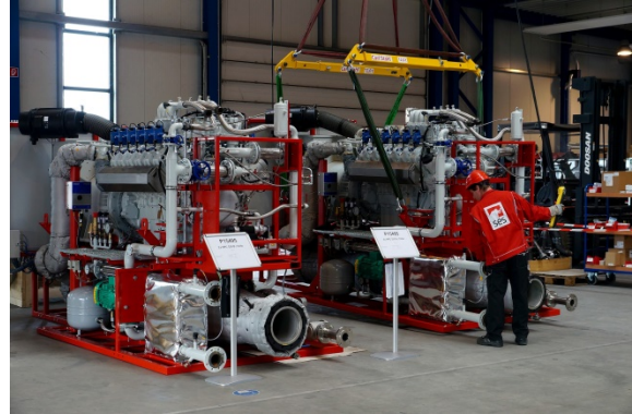
Blockheizkraftwerke von SES werden im eigenen Werk in Leipzig gefertigt.